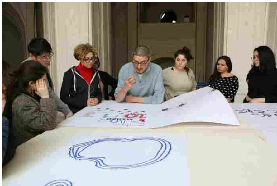
Cesare Pietroiusti.

Io credo che sia opportuno innanzitutto sbarazzarsi dell'idea che l'arte debba fare qualcosa. La ricerca e l'operare dell'artista propongono sempre e comunque spazi di libertà, di possibilità, di gioco, rispetto alle regole, alle abitudini, alle ideologie, e alle prese-di-posizione, siano pure eticamente e politicamente corrette. Per me fare arte significa non "prendere" (occupare) la posizione giusta; piuttosto riconoscere ed elaborare la tensione che esiste nel campo polare fra il "giusto" e lo "sbagliato". Un campo di tensioni che prima di tutto è interiore, psichico, poiché nessuno di noi è