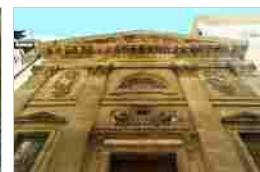
CHIESA SANTA MARIA DEL GIUSINO PALERMO