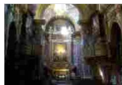
CAPPELLA DI SAN GREGORIO CHIESA DI SAN GREGORIO ARMENO