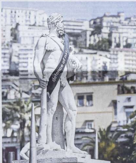
Un'intervento di Igor Grubic in Villa Comunale