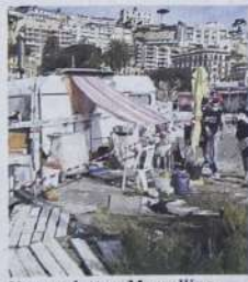
Del Gaudio a pag. 33 Una roulotte a Mergellina

Nuovo blitz ieri mattina della Guardia costiera al Molo Luise. Sigilli ad una struttura abusiva. L'intervento rientra nell'ambito del contrasto agli ormeggi abusivi. Nomi e appalti sono nel mirino della Procura. I magistrati stanno passando al sequestro le concessioni, le carte che consentono a imprenditori e soci di cooperative di gestire boe e sigilli nello specchio d'acqua più ambito: quello che va da Mergellina al Castel dell'Ovo.